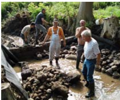
Mændene knokler i mudder og vand for at få lagt stenene på den rigtige måde.

Senere skænkede kong Hans i 1504 også Beldringe kirke til ordenen, og den har sikkert (sammen med kilden)