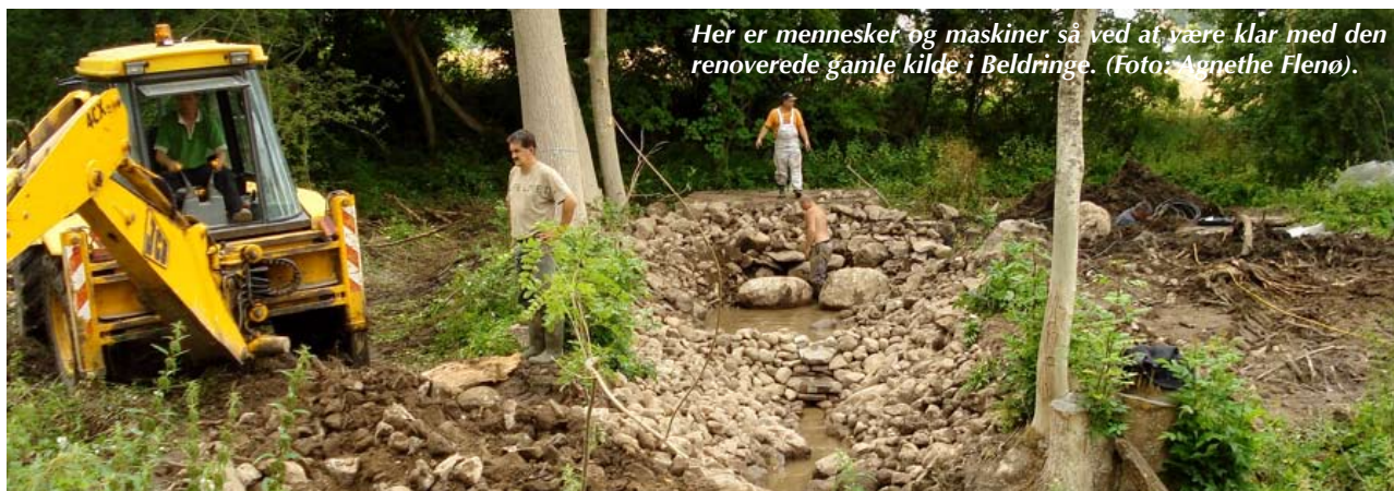
Her er mennesket og maskiner så ved at være klar med den renoverede gamle kilde i Beldringe.