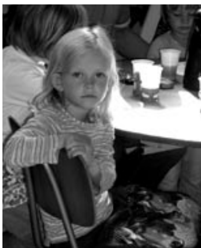
Førskolemøde på Gregers Krabbe Friskolen i Årestrup, Himmerland.

Historien hentet på www.gregerkrabbefriskolen.dk