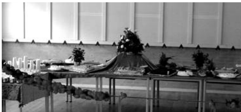
Jordløses kagebord og den røde tråd, før skolen åbner søndag d. 7. august.

Jordløse Friskole er også flyttet ind på den folkeskole, som blev lukket. Skolen var ikke helt billig, men Hårby kommune har gjort lånet rente- og afdragsfrit