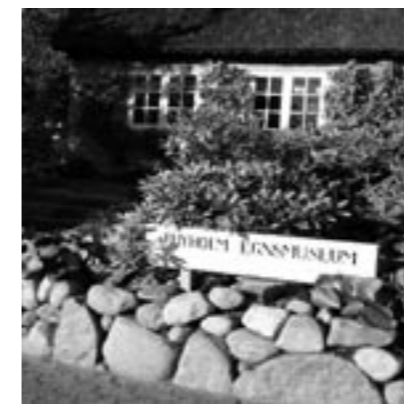
Thyholm Egnsmuseum, Sønderjylland Museum.