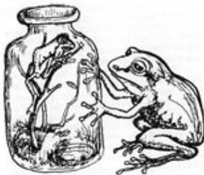
Løvfrøen i glasset er et tidligt barometer. Ill. Ludmilla Balfour

Årets kalender gennemgås, med navnedage, hvis vejr havde betydning for resten af året, og vi får fortalt hvordan man i februar og marts "delte dage" ud til landsbyens beboere. Den der fik en dag, var ansvarlig for vejret den dag, hvis