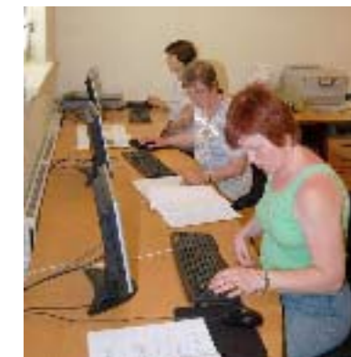
VUC kursus i Erslev. Dansk, matematik, engelsk eller IT?