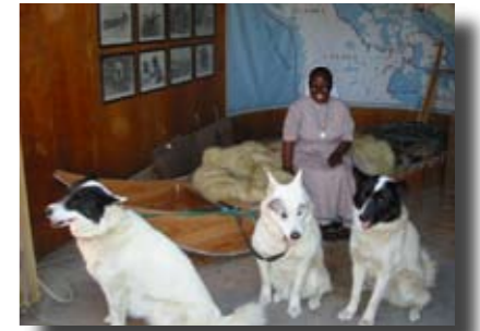
Afrikansk nonne ved Knud Rasmussens hus. Hundene er helt klar, bare slæden kunne køre!

Museet oplever en stadig stigning i interessen for Knud Rasmussen, både m.h.t. besøg og med hensyn til afleverede effekter til museet. Massevis af fotos. Iflg en artikel af museumslederen i sidste medlemsblad, Slædesporet, var Knud Rasmussen en af sin tids mest fotograferede personer, ude og inde, offentligt og i familien. Hos fotografen blev der også taget billeder, og han delte rundhåndet ud af signerede fotos. Mange af dem kommer til hans hus i disse år.