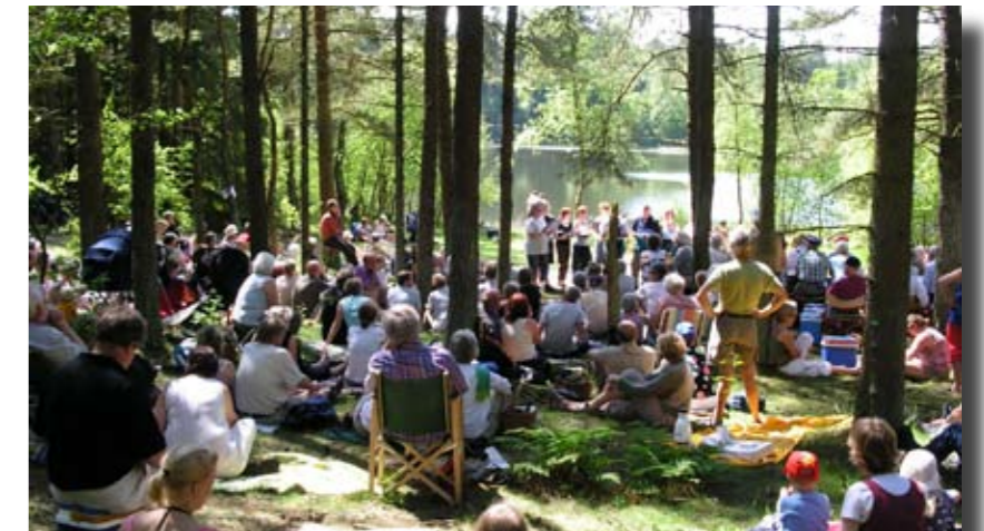
Godt 200 gæster og dejligt vejr ved Egge Sø.

Søndag d. 11. juni havde Vinderup Turistforening, Vestjysk fortælle teater i Ejsing samt Lokalrådet for Vinderup Kommune en fortællepicnic ved den meget naturskønne Egge sø. Det var anden gang, der var et fortællepicnic arrangement.