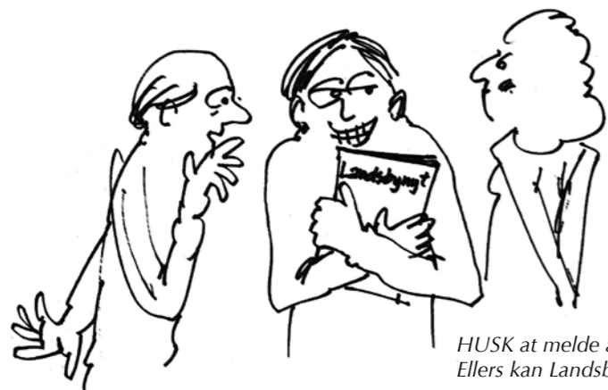
HUSK at melde adresseændring, når I skifter ud i bestyrelsen! Ellers kan Landsbynyt forsvinde med de afgangende bestyrelsesmedlemmer.

Deres billedgalleri er herligt. Der er en overskrift for begivenheden, derefter må man gætte selv. bd