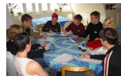
Nordisk Ungdomsseminar med 5 nationer ved bordet.

13.15 – 15.45 * Oplæg, * grupper, * forberedelse til fremlæggelse * Fælles start om foreninger hos jer: Hvor mange foreninger? Hvad for nogen foreninger? Foreningernes arbejde? Børn og Unge i foreningernes bestyrelser? Vigtige foreninger? Hvordan kommer vi med?