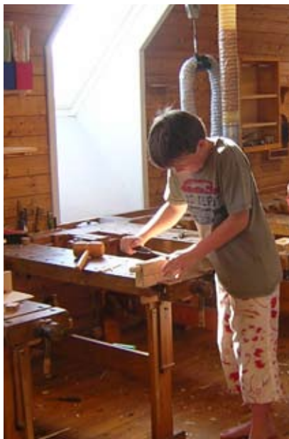
Dyb koncentration om arbejdet

Jeg var selv en af de par tusinde deltagere i den store demonstration i Vinderup, da man havde skolestrukturdebatten, hvor det stod klart at debatten kun drejede sig om, at skolen her skulle lukkes. 1,5 km