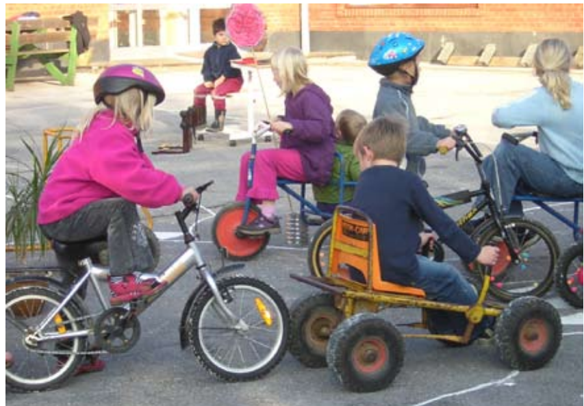
Trafikkaos i skolegården

"Betyder jeres undervisningsform, at I ikke har brug for specialundervisning?" "Nej. Vi har stadig brug for nogle timers indsats. Vi har selvfølgelig samme muligheder som alle andre for at få penge til