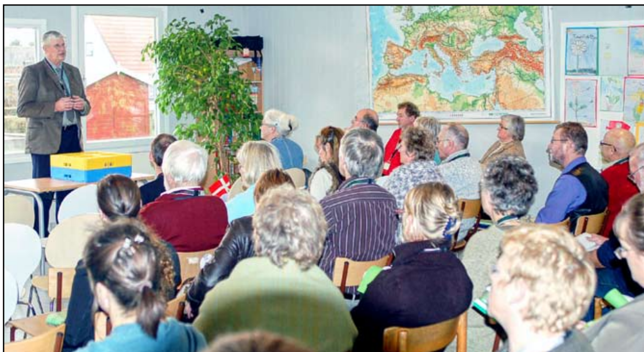
Borgmester i Ulfborg-Vemb byder velkommen til årsmødet.