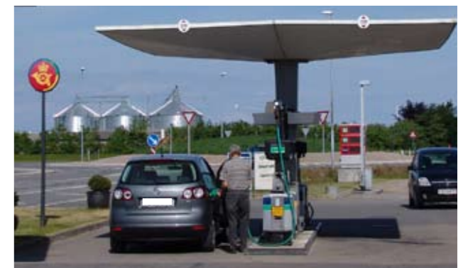
Tankstationen i Hellevad har indrettet postbutik. Her findes også den eneste postkasse i området.

I den senere tid er det blevet mere og mere tydeligt at dele af landdistriktsudviklingen ligger i Post Danmarks hænder. Disse hænder er også politikernes, og fra LAL' side skal vi opfordre til at hænderne bruges på en måde, der tilgodeser alle borgere i Danmark lige meget, hvor de bor! - Måske ved at tænke minimumsstandarder ind for betjening i landdistrikterne! af Trine Testmann, koordinator LAL